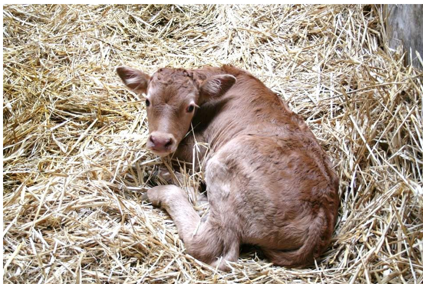
Nyfødt spædkalv i ØkoKalvekampen

Kalvedødeligheden hos økologiske mælkeproducenter ligger på lidt over otte procent. Den er faldet gennem de senere år, men branchen har besluttet, at den skal endnu længere ned. På den baggrund startede SEGES Økologi i 2015 en konkurrence for at få fokus på den økologiske kalvedødelighed.